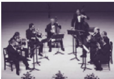
平成8年度ベルリン・フィル八重奏団