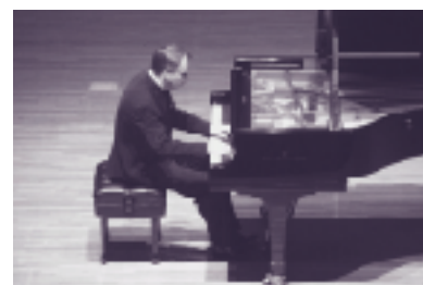
平成17年度ミハイル・プレトニョフ ピアノ・リサイタル