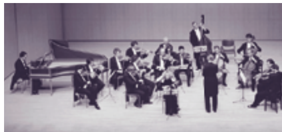
平成12年度ヴェネツィア合奏団