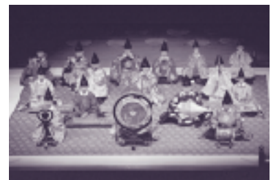
平成15年度雅楽～みやびの世界～