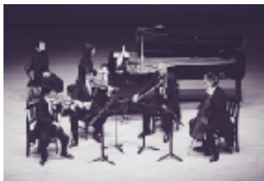
平成11年度ベルリン・フィル・カンマー・ゾリステン