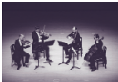
平成9年度ウィーン・ムジークフェライン 弦楽四重奏団