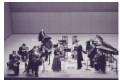
平成10年度ドイツ・バッハ・ゾリステン