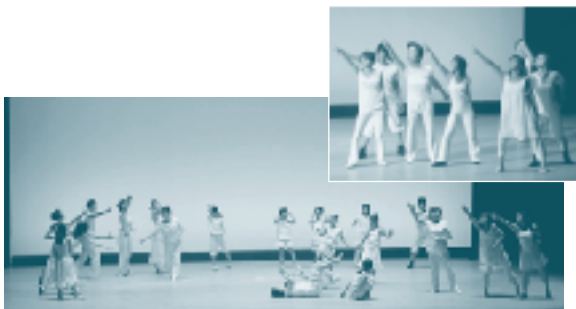
8/24 ダンス・ワークショップ発表会