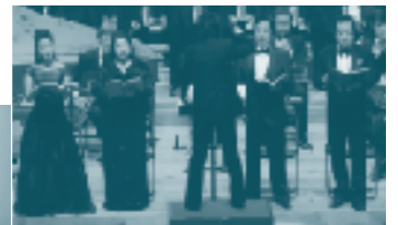
10/22 市民合唱とオーケストラ ヘンデル／メサイア