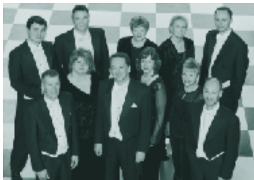
指揮：ピーター・フィリップス

2005年の来演で聴衆を魅了した圧巻のハイ・ヴォイス、多くの再演のご要望に応じて！ これぞまさしくとびきり極上の天上音楽!!その感動は、天から天使が舞い降りるごとく!!!