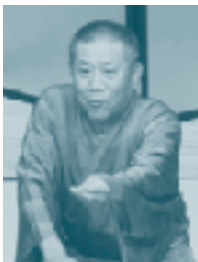
10/11 かわにし寄席 桂 米朝 一門会