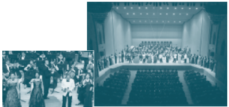
8/26 川西市民オペラ オペレッタ・ガラコンサート