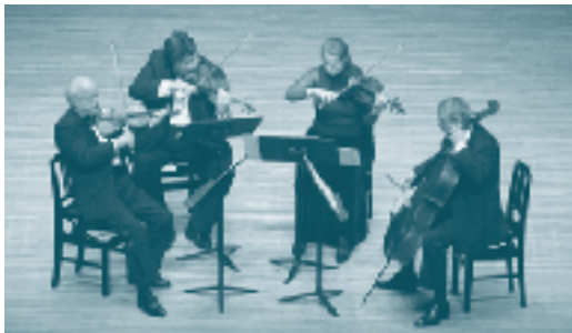
5/27 アルバン・ベルク四重奏団