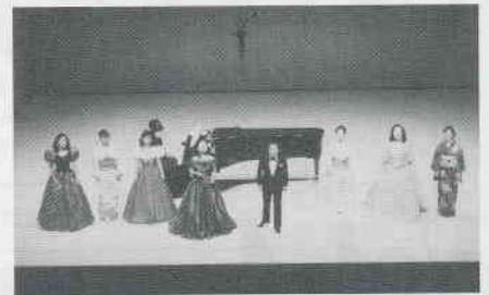
8/4 川西音楽家協会「飛翔」ガラ・コンサートより