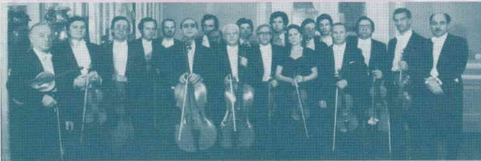
St. Petersburg Philharmonic Chamber Orchestra