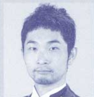
オロヴェーゾ 畑 奨